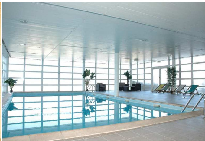
La piscine chauffée en accès libre