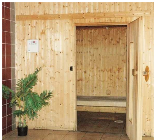
Le sauna en accès libre